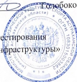
График работы Областного Центра тестирования ГАУ АО «Центр развития спортивной инфраструктуры»